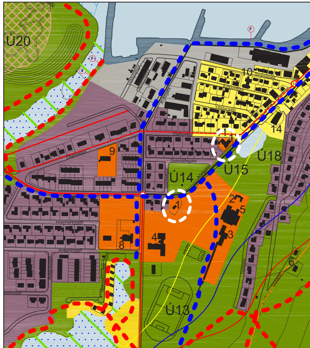
Aðalskipulag Fjallabyggðar 2008 - 2028, fyrir breytingu