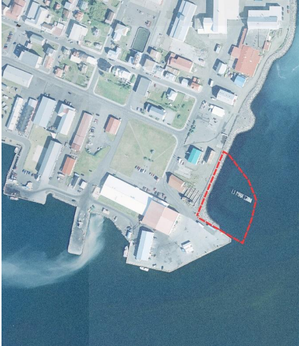
Mynd 1. Afmörkun skipulagssvæðisins. Undirliggjandi er loftmynd frá árinu 2011